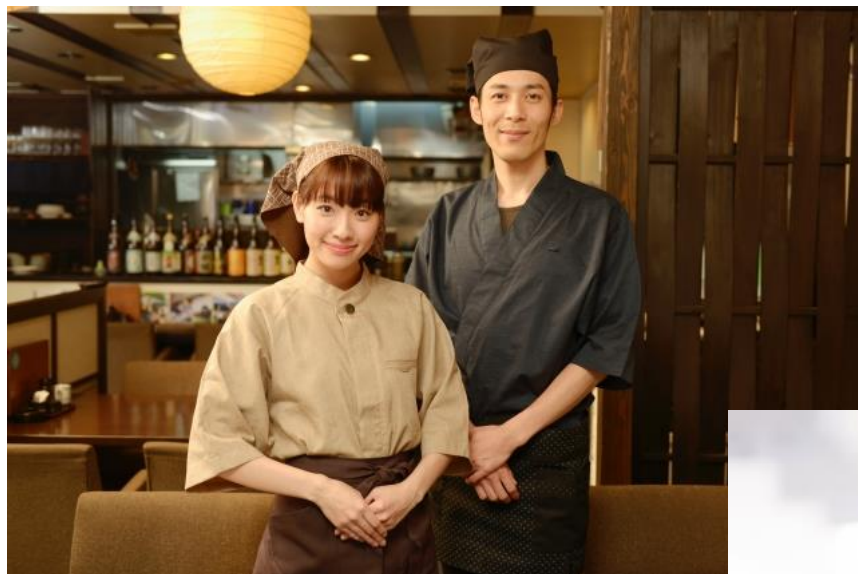
居酒屋を経営される オーナー様

様々なオーナー様がコロナによる売り上げ減少を チャンスに変えるべくチャレンジされています。