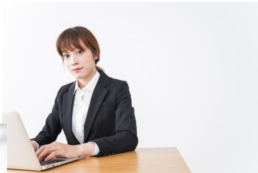
個人事業主でデザイナーをされている オーナー様