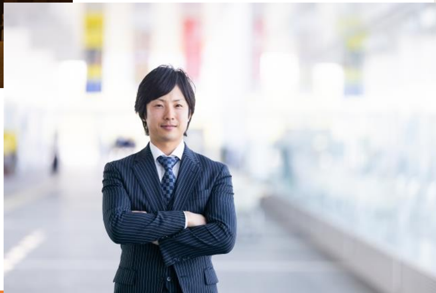
副業OKの企業で営業される オーナー様