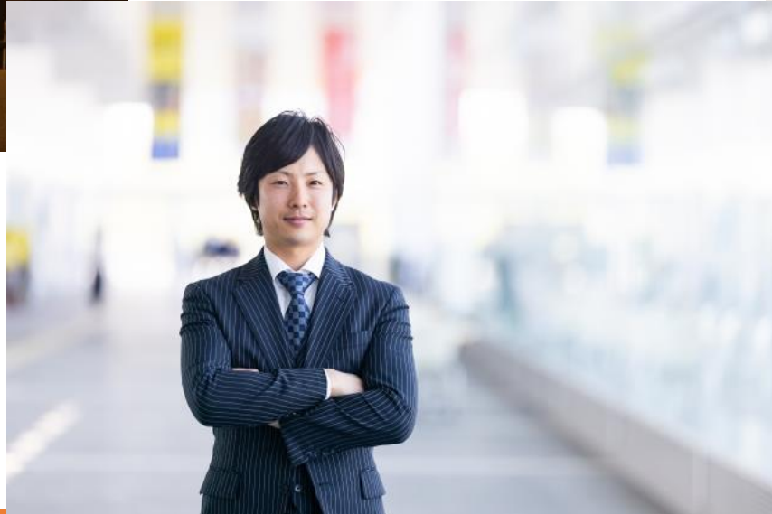
副業OKの企業で営業される オーナー様