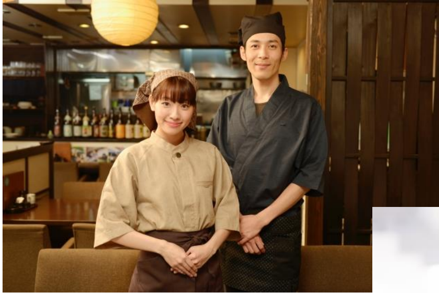
居酒屋を経営される オーナー様

様々なオーナー様がコロナによる売り上げ減少をチャンスに変えるべくチャレンジされています。