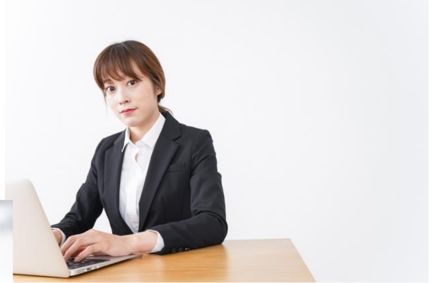
個人事業主でデザイナーをされている オーナー様